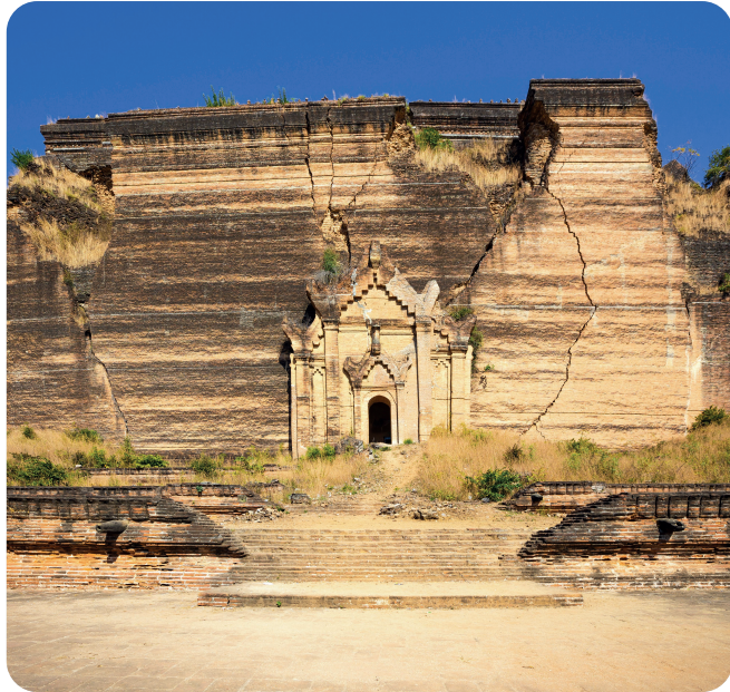
ငလျင်ဒဏ်ခံခဲ့ရသော မင်းကွန်းပုထိုးတော်ကြီး

ငလျင်လှုပ်ခြင်းကြောင့် မြေပြိုခြင်း၊ ရွံ့မီးတောင်များပေါက်ကွဲခြင်း၊ ဆူနာမီနှင့် ရေကြီးခြင်း၊ အဆောက်အဦများပျက်စီးခြင်း၊ လျှပ်စစ်ကြိုးများပျက်စီးခြင်းကြောင့် မီးလောင်ခြင်းတို့ ဆက်လက်ဖြစ်ပွားနိုင်ပါသည်။